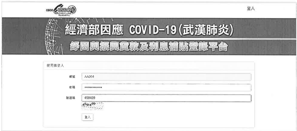
(圖 5)帳號密碼登入介面

C. 點擊信件中-點擊前往登錄網址，進行密碼修改。(圖 5) (第一次登錄需修改密碼)