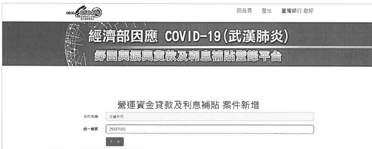
(圖 11)輸入申請者資料