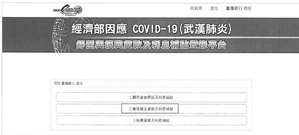
(圖 10) 營運資金貸款及利息補貼