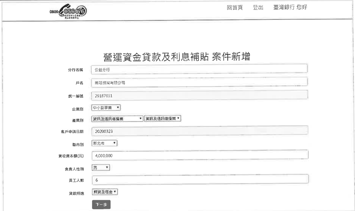
(圖 12)輸入申請者公司基本資料